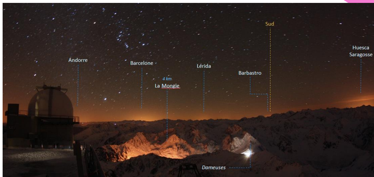
Illustration 3: Ciel et horizon depuis l'Observatoire du Pic du Midi (Pyrénées).