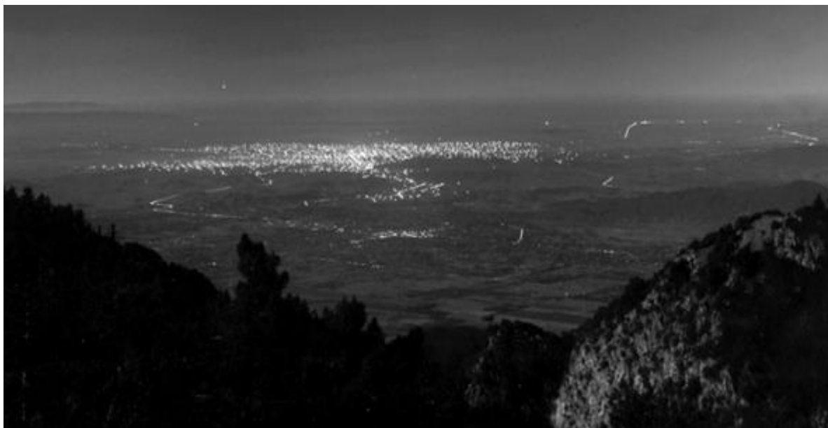
Illustration 1: Vue depuis l'Observatoire du Mont Wilson (Etats-Unis) vers Los Angeles, en 1908.